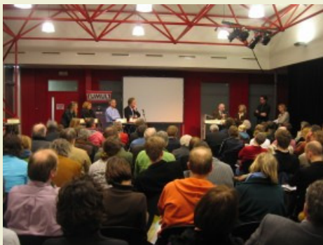
Limesdebat in Utrecht 2007

In 2008 vond in debatcentrum Tumult in Utrecht het debat 'Verbinding Leidsche Rijn-Utrecht langs de Limes-weg' plaats, georganiseerd door Programmabureau de LIMES in samenwerking met Architectuurcentrum Aorta, Gemeente Utrecht en Stichting Domplein 2013. Het thema was de relatie tussen archeologie en stedenbouw en de rol die de Limes daarin kan spelen. Hierbij werd specifiek ingegaan op de nieuwe verbinding tussen Utrecht en Leidsche Rijn. Op zowel het Domplein als in Leidsche Rijn ligt een castellum en de Limes zou als verbindend element gebruikt kunnen worden tussen de oude en de nieuwe stad.