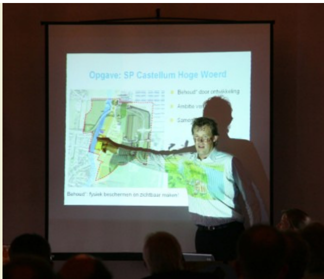
Presentatie tijdens gemeenteseminar 2007

Dit jaar zal een tweede Limes Gemeenteseminar georganiseerd worden. Uitgebreide informatie hierover is te vinden in de rechterkolom van deze nieuwsbrief.