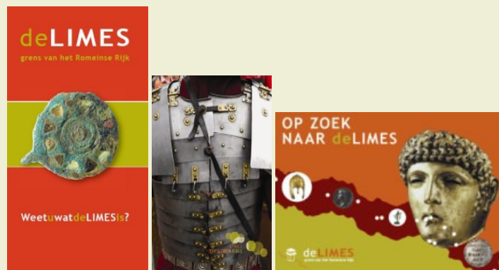
V.l.n.r. Limesfolder, ansichtkaartenboekje en Limesgids

Naast publicaties die zijn ondersteund, zoals het prachtige boek De Limesweg, heeft het Programmabureau ook veel materiaal rondom de Limes zelf uitgebracht. Voorbeelden hiervan zijn de gratis Nationale Limeskaart (in oude en hernieuwde uitgave in totaal bijna 30.000 exemplaren), de Limesgids (5.000 exemplaren, nu nog beperkt bij een aantal musea te verkrijgen), diverse folders, fietsrouteboekjes, een mooi ansichtkaartenboekje van de Limes Erfgoedkring en nog veel meer.