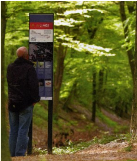
Limesbord in Groesbeek

In Bodegraven, Groesbeek, Leiden, Woerden en Elst is de markering al zichtbaar. Nijmegen, Zwammerdam, Katwijk, Houten, Millingen aan de Rijn zullen volgen en er komen ook nog extra borden in Groesbeek en Elst.