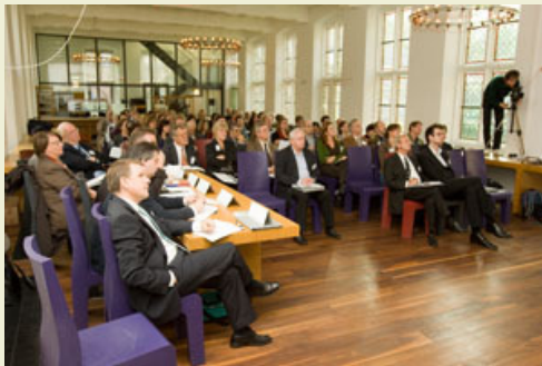
Symposium Visiting the Past-Meeting the Limes

Eind 2007 vond in het Centraal Museum in Utrecht het internationaal wetenschappelijk symposium 'Visiting the past-Meeting the Limes' plaats, een initiatief van Universiteit Wageningen en Programmabureau de LIMES in samenwerking met de Katholieke Universiteit Leuven en GAIA Heritage.