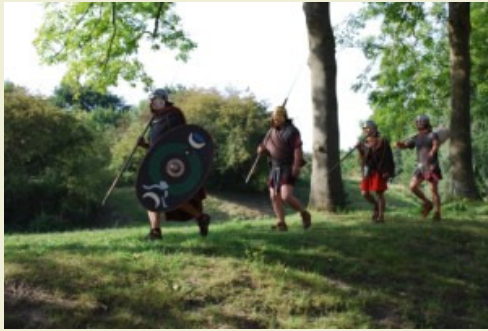
Beeld uit de DVD Fort aan de rivier

alleen archeologen, heeft bureau TGV teksten en presentatie in opdracht van de Universiteit een lespakket samengesteld voor de onderbouw van het voortgezet onderwijs. Via de erfgoedhuizen van Zuid-Holland en Utrecht wordt het pakket vier jaar lang verspreid op scholen die in de Limesgemeenten liggen. Het is namelijk de bedoeling dat leerlingen ook in hun eigen omgeving iets van de Limes kunnen zien en ervaren, en dat is in Zuid-Holland en Utrecht bij uitstek het geval.