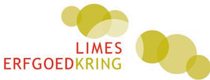
Logo Limes Erfgoedkring