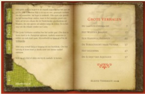
Het boek met verhalen op www.limesquaestio.nl

lossen en geven je - als je de goede antwoorden online op www.limesquaestio.nl invult- een mooi verhaal kado. Als je niet in de buurt van deze stenen kan komen, blijft het mogelijk ook alleen het grote verhaal in het mooie oude boek te lezen. Maar ook daar moet je wel eerst je Limeskennis voor laten testen.